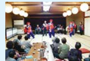
大黒舞を通じて地域の方との交流を深めています。

塩崎大黒舞では、デイサービスや福祉施設などで民謡や大黒舞を披露しています。メンバーはそれぞれが尺八、三味線、踊り、歌等を習いながら、大黒舞の活動もされています。メンバーで集まって練習をし、互いに学び合い、大黒舞を受け継ぎながら楽しんで活動をしています。