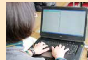
パソコンを用いて点字データ化しています。