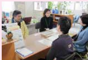
市民活動にかかわるさまざまな相談に対応しています。