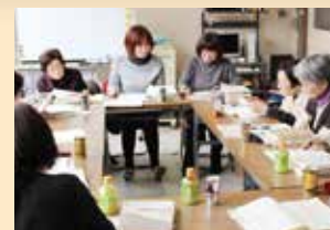
月1回の勉強会では校正の仕方について話し合いを行います。