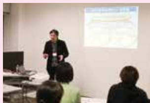
年間50～60回研修会を開催しています。

年齢や立場を超えたたくさんの人とのつながりがもてる市民活動に取り組んでみませんか。