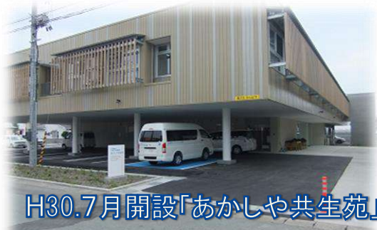
H30.7月開設「あかしや共生苑」