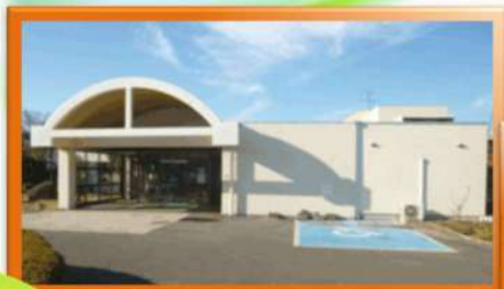
特別養護老人ホーム芙蓉荘

◆お申込み 参加申込書をハローワーク酒田又は福祉人材センターにお申し込みください。 電話・FAXでも可能です。