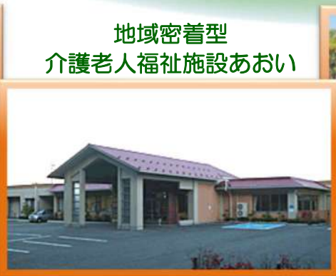
地域密着型 介護老人福祉施設あおい