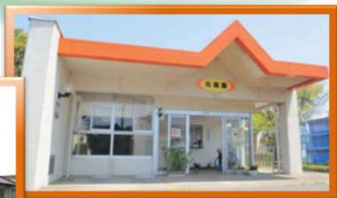
障がい者支援施設光風園