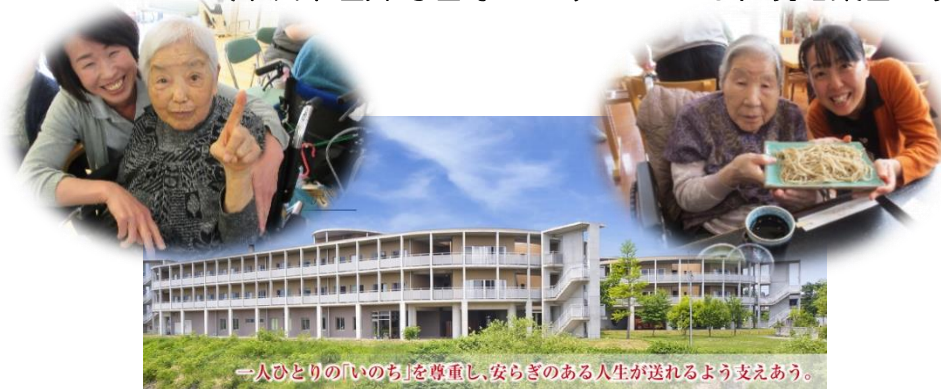
一人ひとりの「いのち」を尊重し、安らぎのある人生が送れるよう支えあう。